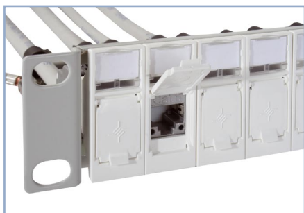
Kit de désignation et porte de protection pivotante